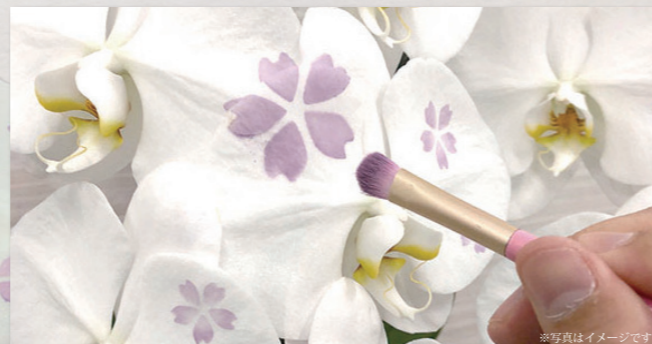
職人が一筆一筆手書きで描き入れております。

化粧蘭は特殊なパウダーを用いてワンポイント化粧した胡蝶蘭です。 文字・絵柄の入れ具合、企業ロゴマークもご相談に応じます。